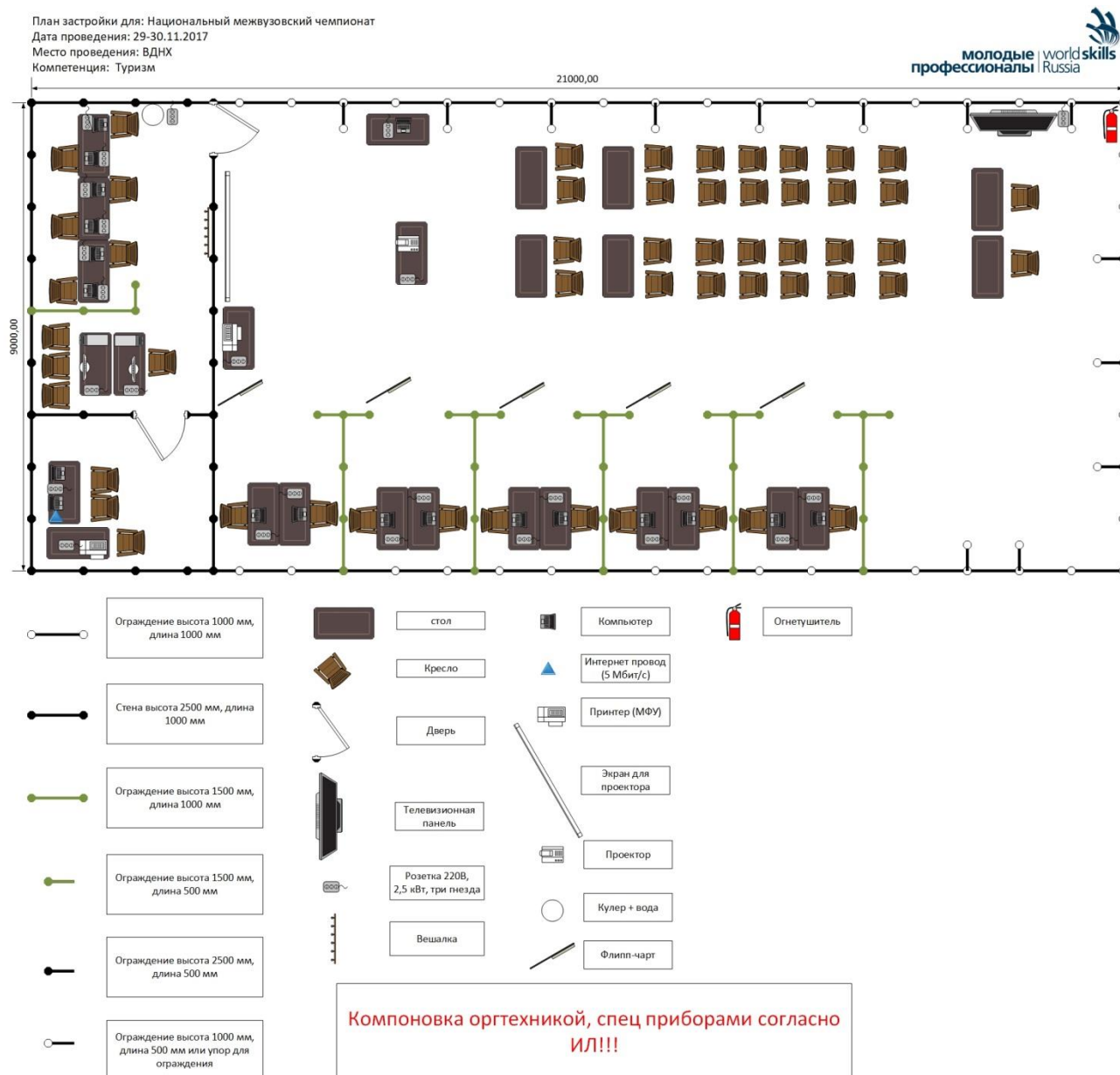
Схема конкурсной площадки